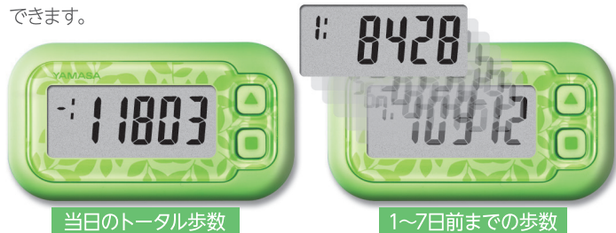
当日のトータル歩数